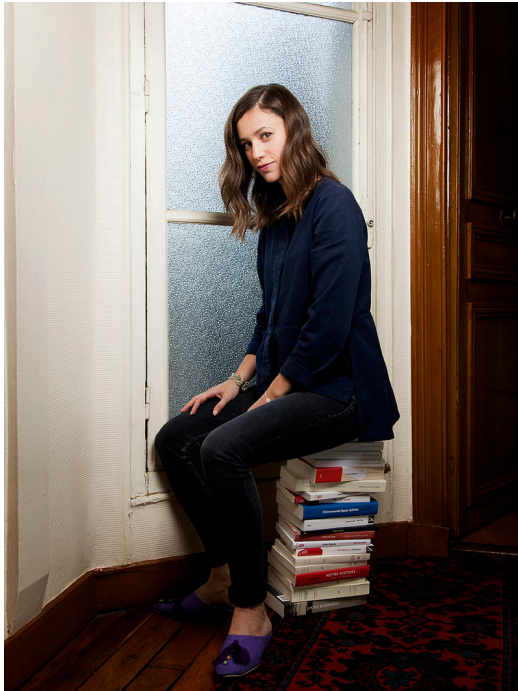
Kaouther Adimi